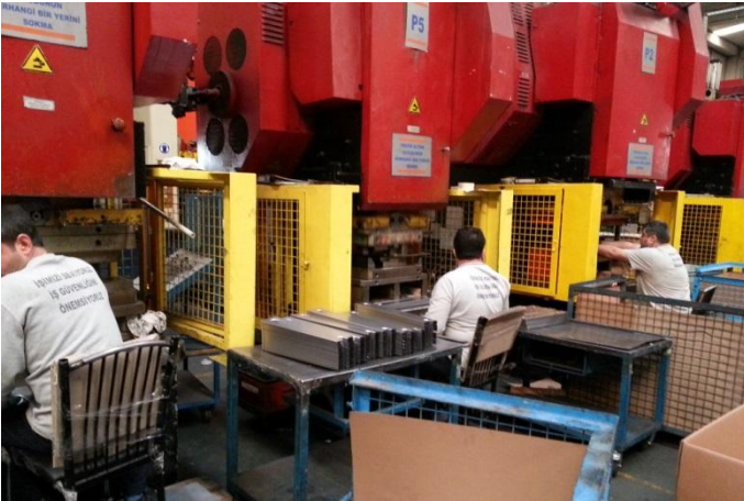
İzmir Kalıp, Manisa.

yerinde İşbirliği”, “Kalite Kontrol”, “Daha Temiz Üretimle Verimliliğin Artması”, “İşletme ve İşbirliği Başarısı için İşgücü Yönetimi” ve “İş Sağlığı ve Güvenliği” alt başlıklarından oluşuyor. Her modül iki günlük teorik ve iki günlük pratik eğitimi kapsıyor. Teorik eğitimler beş adet firmaya birlikte verilecek olup, eğitimlere her işletmeden iki işçi ve